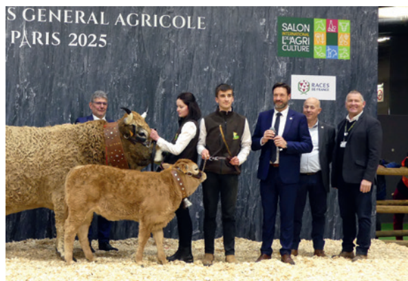
Fabrice PANNEKOUCKE, Président de la Région Auvergne Rhône-Alpes