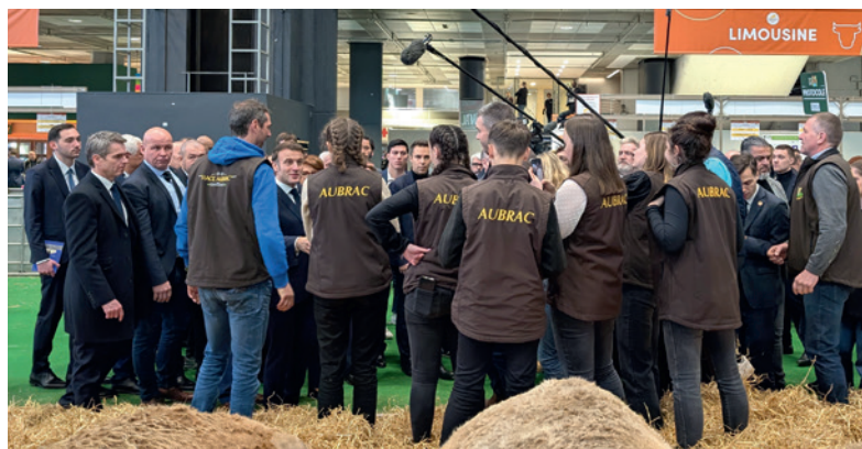
Emmanuel MACRON, Président de la République