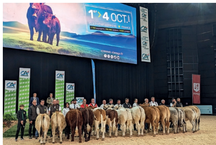
Photo finale des animaux mis aux enchères

« La cérémonie de remise des Sabots d'Or s'est tenue au Sommet de l'Élevage le 4 octobre 2024. Ce concours récompense chaque année au niveau national les meilleurs binômes d'éleveurs et conseillers Bovins Croissance.