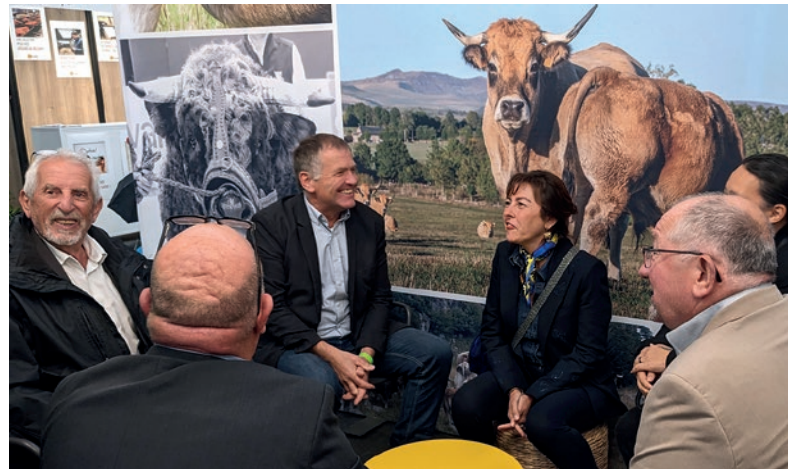
Carole DELGA, Présidente de la Région Occitanie, sur le stand de l'OS Race Aubrac

grandement. Nous remercions également l'intégralité des personnes ayant pris part à cet événement, ainsi que nos juges.