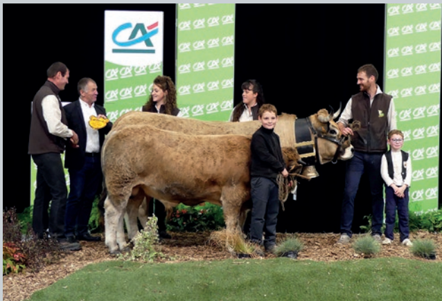
CHAMPIONNE : ISETTE - GAEC BENOIT (07)