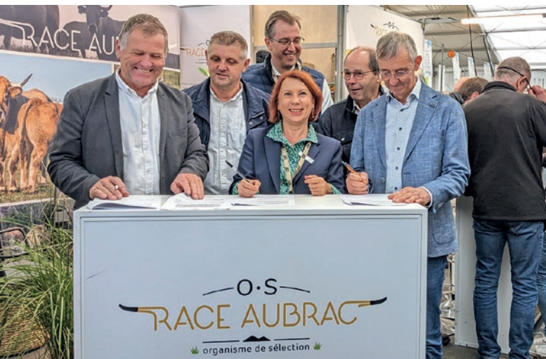
Signature de la convention pluriannuelle avec le Crédit Agricole